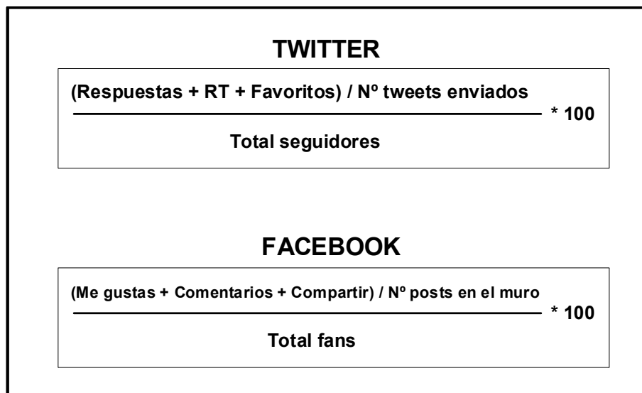
Figura 3. Tasa de engagement en Twitter y Facebook

Otras plataformas 2.0 al servicio de la comunicación empresarial y publicitaria son el blog o Youtube. En el caso del blog, medible con la herramienta gratuita Google Analytics, son KPIs clave el número de publicaciones , el número de visitas, el número de posts comentados, el número de posts compartidos, el tiempo medio en el site o de dónde provienen las visitas, entre otros.